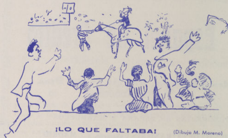
LO QUE FALTABA!

Cada cosa tiene su época. Hoy toca futbol, mañana toros y