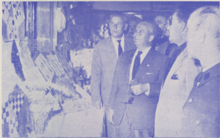
El Excmo. Sr. Gobernador Civil de la provincia en su visita a la Exposición Escolar

La Directiva y Consejo de Redacción de este semanario agradecerá a nuestros lectores le indicaren aquellas secciones que sean más de su agrado, así como también cualquier sección que por premura no se hubiere insertado y fuere de interés.