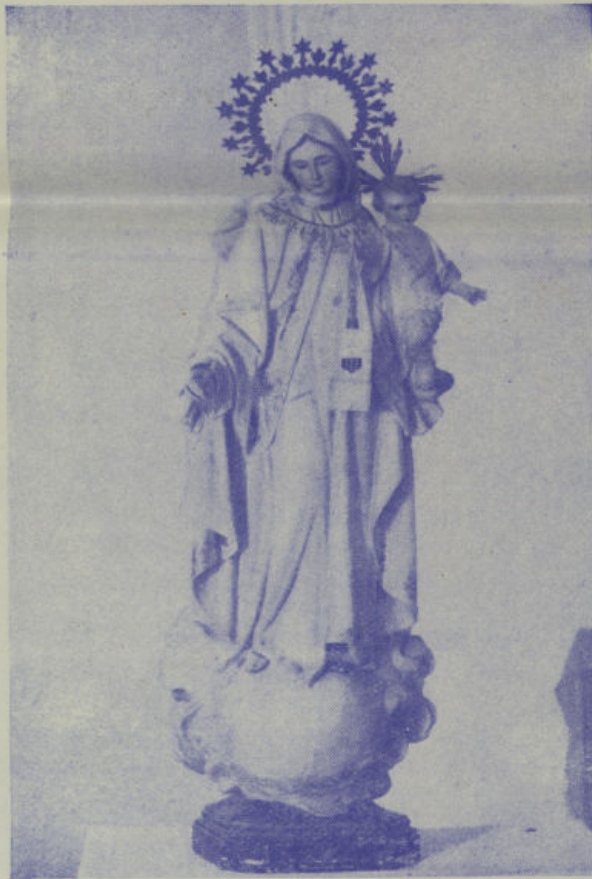
Stma. Virgen de las Mercedes, en cuyo honor se celebran las Fiestas y Feria de esta ciudad, del 23 al 29 de Septiembre