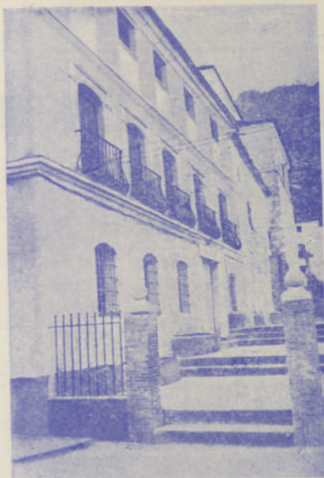
Una de las fachadas del Balneario

Para su REUMATISMO, las aguas termales de