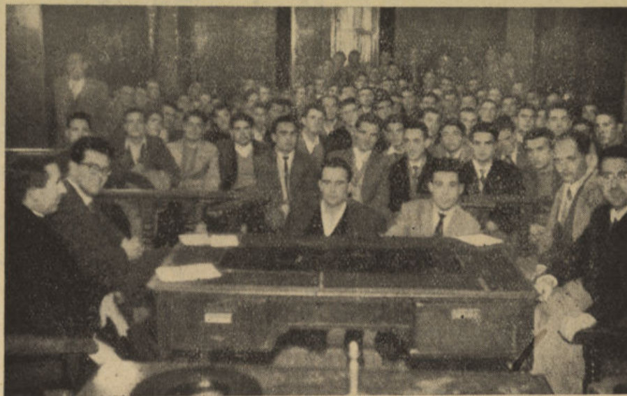
CICLO DE CONFERENCIAS. —Aspecto que ofrecía el Salón de Sesiones del Excmo. Ayuntamiento en una de las charlas preliminares que se han dado a los reclutas del reemplazo 1957, organizadas por la Juventud Masculina de A. C. (Véase información en páginas interiores)

Precisa emprender una campaña en la que todos los pueblos se unan y con la colaboración de aquellos vecinos que se consideren más capacitados para su dirección y logro, pidan y gestionen la realización de lo que, a no dudar, daría a el Valle motivo para que su riqueza se mostrase ante todos como debe, y su desarrollo y auge tuvieran los medios que tan justamente merecen.—JUAN OCAÑA