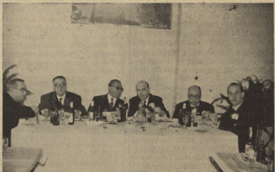
Presidencia de la comida ofrecida a nuestro paisano

TEATRO VARIADADES ❁❁ VILLANUEVA DE CORDOBA