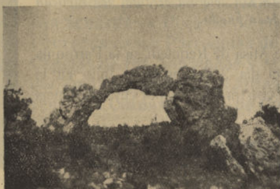
LA PIEDRA «JORADÁ»

No se puede amar lo que se desconoce. Nuestra sierra, llena de bellos parajes, se hace más entrañable cuanto más la conocemos.