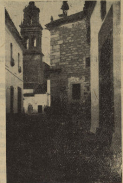
Una calle de Dos-Torres

las primeras luces en Dos-Torres. Es tradición muy extendida, aunque ignoramos si existen documentos que la comprueben, que el Pontífice nombrado, muy agradecido por haberle salvado el doctor de una peligrosa enfermedad, lo honró con varios regalos que a su vez donó éste a su pueblo natal. Fueron algunos de estos regalos la Virgen de Loreto, un cuadro figurando el Espíritu Santo y una valiosa Cruz con muchas reliquias.