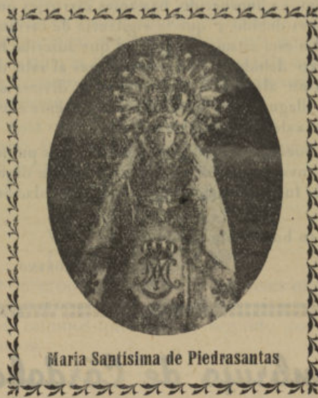
María Santísima de Piedrasantas

Viene después el reinado de los Reyes Católicos y con ellos la admiración y ayuda a nuestra patria chica, por la que sienten verdadero cariño. Y crean en ella instituciones de cultura y centros de beneficencia y caridad. Y ayudan con largueza a nuestro Gran Capitán, Gonzalo Fernández de Córdoba en su magna empresa de construir una Iglesia en Pedroche, obra que fué terminada en 1.510 y que se dedicó al culto de Ntra. Señora del Socorro, cuyas ruinas forman lo que hoy es Cementerio Municipal.