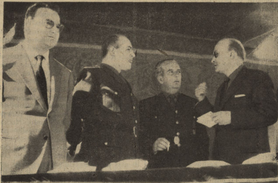
El Excmo. Sr. Ministro acompañado del Sr. Gobernador Civil (a su izquierda), Presidente de la Diputación Provincial (a su derecha) y el Alcalde de esta ciudad, en la tribuna del Campo de Deportes

Pozoblanco, con este motivo, vibró de entusiasmo el pasado día 21, testimoniando su adhesión ferviente al Caudillo de España en la persona de su ilustre representante.