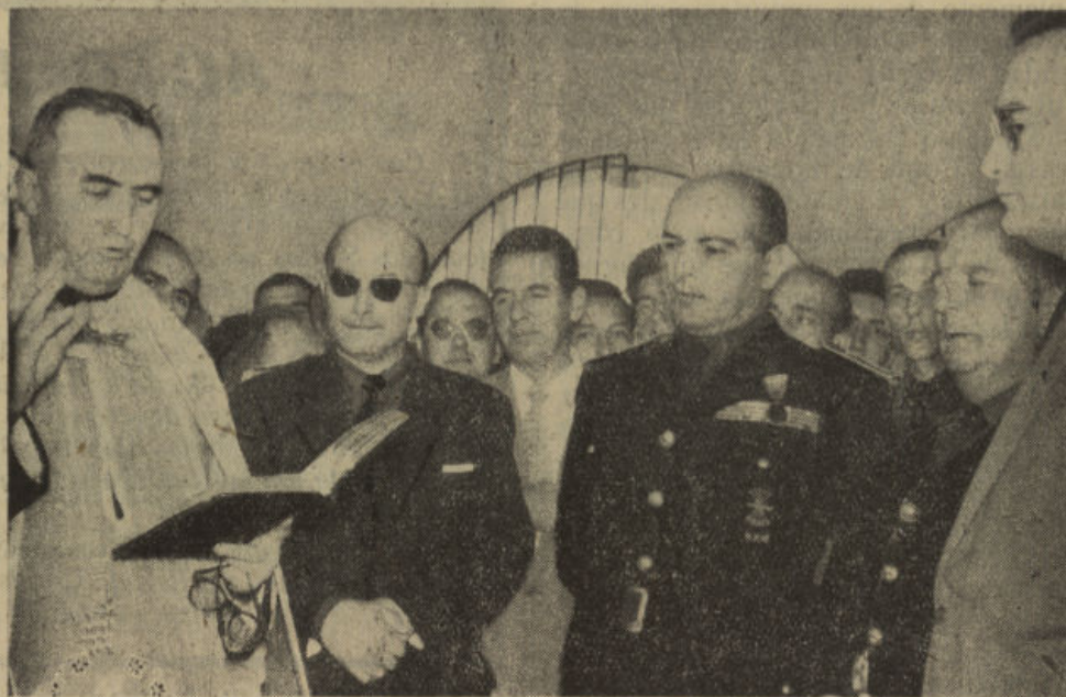
Acto de la bendición de los locales del nuevo Mercado Municipal de Abastos

A continuación de los actos celebrados en el Campo de Deportes, el Sr. Ministro y sus acompañantes se dirigieron a pie, entre las aclamaciones del vecindario y una enorme masa de gente que seguía el paso de la comitiva por nuestras calles, a la Cruz de los Caidos, donde fué rezado un responso, y por el Sr. Solís fué ofrendada una corona de laurel.