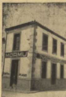
San Isidro, 1. Tel. 64 POZOBLANCO