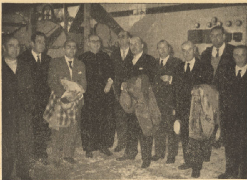
Autoridades y Junta Rectora en la nave de máquinas de la Almazara

No nos atrevemos a expresar que el encauzamiento por la fórmula de cooperativismo de las actividades de nuestros labradores y ganaderos sea el único camino a seguir para resolver sus problemas actuales, pero sí queremos hacer constar que probablemente en el momento presente sea el más idóneo. Estamos viviendo una época en la que el labrador aislado con sus antiguos procedimientos y medios de explotación no puede hacer frente a la in-