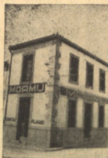
San Isidro, 1. Tel. 64 POZOBLANCO