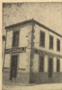
San Isidro, 1. Tel. 64 POZOBLANCO