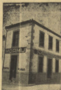
San Isidro, 1. Tel. 64 POZOBLANCO