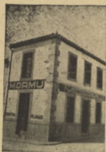
San Isidro, 1. Tel. 64 POZOBLANCO

Felicitamos a las Directivas de todas las Cofradías por el entusiasmo que han puesto para dar el mayor esplendor a los "pasos".