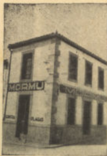
San Isidro, 1. Tel. 64 POZOBLANCO