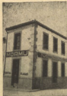
San Isidro, 1. Tel. 64 POZOBLANCO