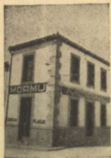
San Isidro, 1. Tel. 64 POZOBLANCO

OCASION Se vende Moto «Ossa» último modelo - Razón: Teléfonos 183 y 242