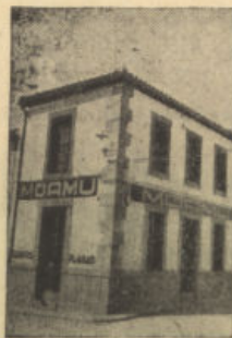
San Isidro, 1. Tel. 64 POZOBLANCO