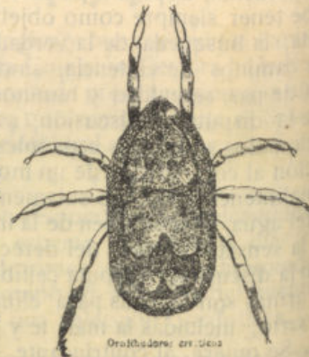
Orfobates: etc. etc. Chinchorro de los cerdos