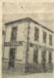
San Isidro, núm. 1 POZOBLANCO