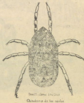
Ornithodoros erinaceus Chinchorro de los cerdos