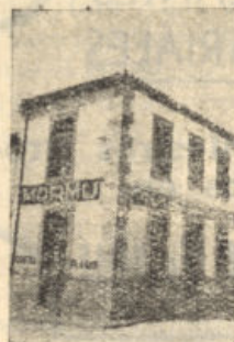
San Isidro, núm. 1 POZOBLANCO

En definitiva, gracias al entusiasmo de la Comisión Gestora, a la colaboración del Excmo. Ayuntamiento y de ese buen puñado de aficionados inasequibles al desaliento, tendremos fútbol, y el C. D. Pozoblanco sabrá "pasear" con orgullo sus colores por los Campos de Andalucía. Y Tigalu, sin primas ni nóminas, cuartillas y pluma en ristre, volverá a estar en la grada al servicio de los lectores de EL CRONISTA DEL VALLE.