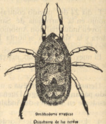
Ornithodoros erraticus Chinchorro de los cerdos