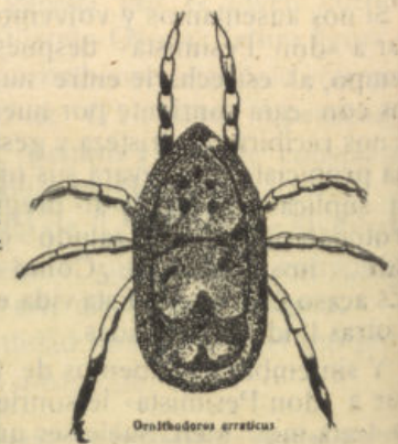
Oenitobius ereticus Chinchorro de los cerdos