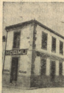
San Isidro, núm. 1 POZOBLANCO