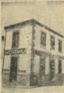
San Isidro, núm. 1 POZOBLANCO