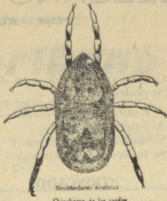
Oenitodorus erraticus Chinchorro de los cerdos