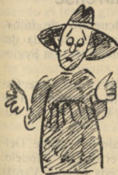
Como no tiene cosecha, no tiene dinero.

La Cooperativa Olivarrera "Los Pedroches", durante los días 2 y 3 del mes de Noviembre, admite ofertas de portes de aceituna para la próxima campaña.—Dirigirse por escrito a las oficinas de la misma.