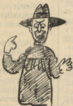
Como no tiene dinero, no fumiga.