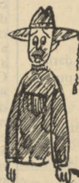
Como no tiene cosecha, no tiene dinero.