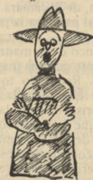
Como no fumiga, no tiene cosecha.