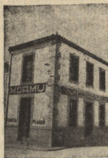
San Isidro, 1