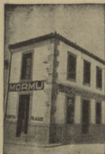
San Isidro, 1 - Tel. 64 POZOBLANCO