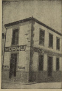
San Isidro, 1 - Tel. 64 POZOBLANCO