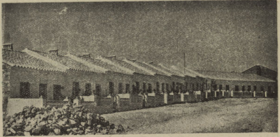
PRIMER GRUPO DE VIVIENDAS «OPERACION LADRILLO»

Por su parte, el Patronato «Felipe Rinaldi» ha iniciado la construcción de 53 viviendas de «renta limitada» que tienen un presupuesto global de 4.419.411'10 pesetas, que vendrán a cubrir una necesidad muy sentida para la clase a que se destina.