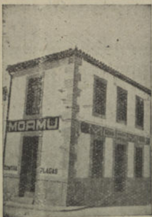
J. Benavente, 3. POZOBLANCO. Tel. 64

La proximidad del centro de producción permi- te ofrecer a igualdad de calidad mejores precios o a igualdad de precios mejores calidades.