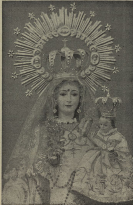
María Santísima de las Veredas, Patrona de Torrecampo. En la frente de la sagrada imagen puede apreciarse el agujero que le produjo el tiro de un desalmado miliciano el año 1.936