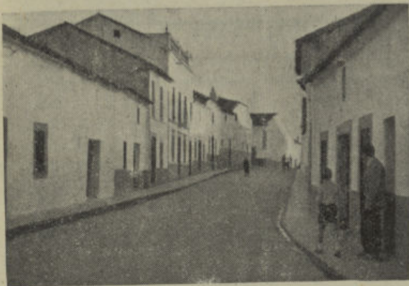
Calle de las Tiendas, pavimentada en el anterior plan de urbanización