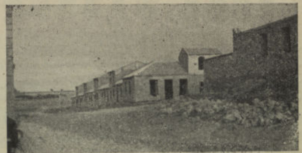
Grupo de viviendas que la Obra Social Cordobesa comenzó a construir, llevando paralizadas las obras hace varios meses