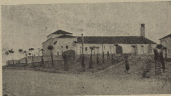
Ermita y Plaza de la Virgen de Gracia

—Llevar a cabo el olvidado trazado que hace unos años se hizo, y que parece duerme el sueño de los justos, de la carretera de Pozoblanco a Torrecampo, pasando