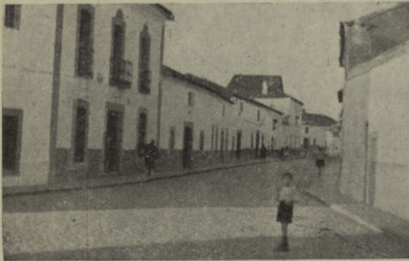
Calle Cánovas, urbanizada en los pasados años