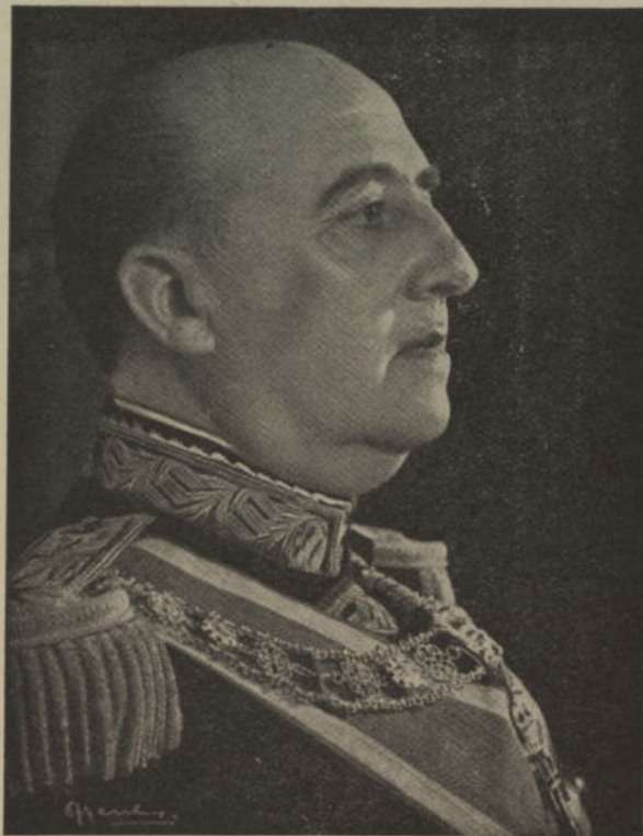
Franco, gobernante ejemplar

El pueblo cordobés, los pueblos de la campiña y de la sierra cordobesas se volcaron materialmente en cuerpo y alma para recibir al Caudillo salvador, al hombre que con la ayuda de Dios ha hecho posible que España sea un oasis de paz en un mundo angustiado. Pozoblanco y los pueblos del Valle que un día conocieron la hora del dolor, saben muy bien cuanto deben a Francisco Franco. Y con nosotros, con los hombres, mujeres y jóvenes vallesanos, que afluíamos en incontenible riada humana a nuestra capital de provincia, iba también espiritualmente nuestra Legión de Caídos que, el día 4 del mes en curso, quiso cambiar la frialdad del mármol por el aire caliente y apasionado de una recepción sin par. Y era el pueblo cordobés sin distinción de clases sociales, sin diferencia