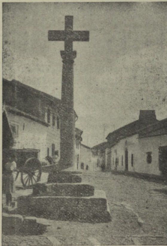
Antigua Plazuela del Risquillo

Allí, en sus descomunales losas de granito, se jugaba a los «bolos», a los «generales», a «cebolla». Allí se han celebrado disputadas exposiciones al aire libre de grillos ceboleros, portados en artísticas jaulas o en modestas latas agujereadas («que si el mío canta más que el tuyo»; «que si el mío es un grillo real»). Allí se