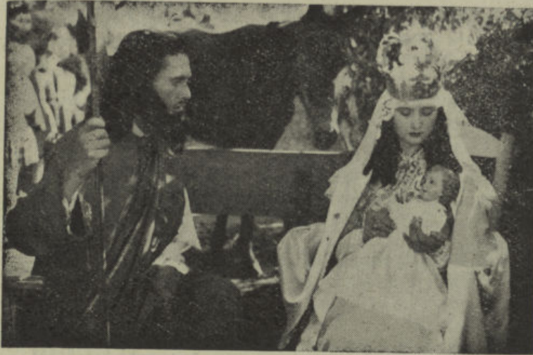
Una escena del Misterio de los Santos Reyes

Este valle de Los Pedroches, mezcla étnica de Andalucía, Extremadura y la Mancha, conserva en su dilatado seno, típicas tradiciones, que el paso del tiempo no ha podido borrar, y que sus habitantes, con un valor de hombre y cariño de madre, han sabido poner a cubierto de extrañas innovaciones. Una de estas fiestas, quizás la más meritoria, es el «Misterio de los Santos