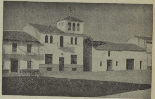
Vista parcial de la Plaza.

La solución total del problema que nos ocupa está pendiente de que un día llegue a ser realidad el ansiado pantano de Guadalmaz. Nuestras esperanzas no están perdidas pero sí algo retardadas, dada la paralización que se observa en el expediente del pantano. Para imprimirle celeridad a aquel proyecto, se nombró una Comisión estudiantiva integrada por los señores Alcaldes de Villanueva de Córdoba, Pozoblanco, Alcaracejos y El Viso, presidida por el Ilustrísimo Sr. Presidente de la Excm. Diputación Provincial. Aquella Comisión dió por terminados sus trabajos con la reunión celebrada en la Diputación en el mes de Octubre del pasado año. Desde esta fecha no se ha vuelto a tocar más el asunto de una manera colectiva. Individualmente, se expuso al Sr. Gober-