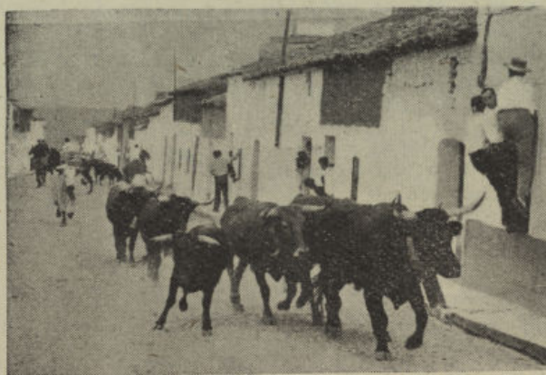
Uno de los más típicos y emocionantes festejos taurinos es el «encierro»

tauromaquia; se conservan las capeas, pero ya el «toro de muerte» se reserva para una sola lidia, que es la final. El máximo esplendor se consigue en el periodo comprendido, aproximadamente, entre los años 1923 a 1930; porque una ganadería de reses de lidia es propiedad de los señores Linares, hijos y vecinos de este pueblo; ello hace que los festejos se aumenten y multipliquen llegándose a la celebración de corridas nocturnas, teniendo lugar, más de una vez, la suerte que inventara don Tancredo López y que tanto éxito tuvo en Madrid y demás plazas españolas. Aquella época de apogeo culminó en las fiestas de 1930, en las que tuvo lugar una inolvidable corrida goyesca, viéndose invadido nuestro redondel por pajes, heraldos, timbaleros, caballeros en plaza y toreros de la época de Goya. A esta era triunfal siguió un pequeño colapso coincidente con el malestar político de España; decreció la llama de aquella hoguera taurina, sin que