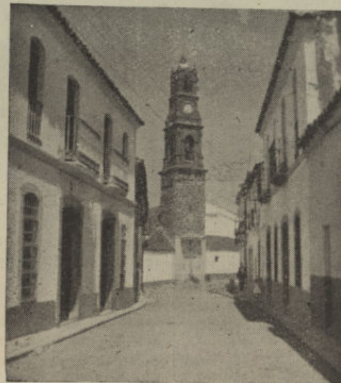
Calle de Cristo Rey, al fondo la artística y esbelta torre de la Parroquia, a cuyo pie está la Cruz de los Caídos