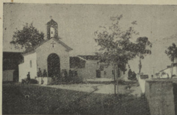
La típica y artística Ermita del Cristo donde los historiadores cuentan que Cervantes «fizo» hacer alto a D. Quijote y Sancho Panza.