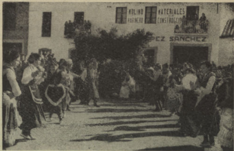
Danzas pastoriles del Misterio de los Santos Reyes