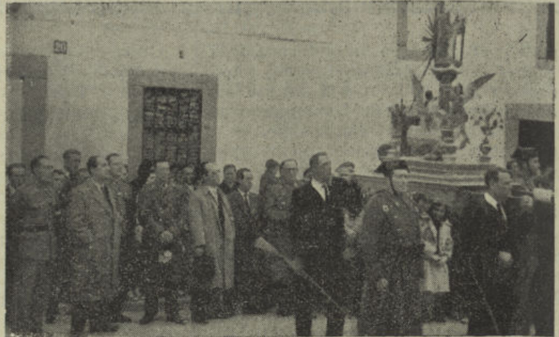
Presidencia de la procesión de la Virgen de Guía el día de su entrada en la villa.

Así pensé yo el 24 de febrero de 1954. Fueron pasando los años y en ese discorrir del tiempo, cambió mi mentalidad y como consecuencia lógica, llegué al con-