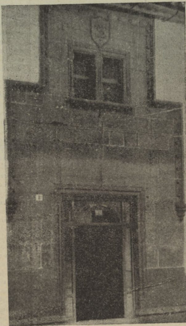
Fachada de la Casa del Casino

"Casa del Casino" .—Así llamada hoy día la número 8 de la calle de Jesús, cuya fachada es el más importante monumento gótico civil del N. de Córdoba. Ella resume, como obra maestra, toda la arquitectura que hemos llamado «pedrocheña» por tener rasgos genuinos aquí y en otros