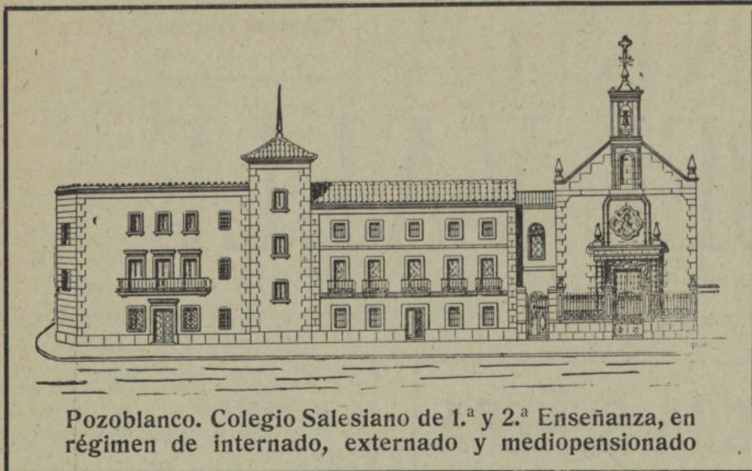
Pozoblanco. Colegio Salesiano de 1. a y 2. a Enseñanza, en régimen de internado, externado y mediopensionado

der ser «adelantados» en esta gran Revolución que iniciamos el 18 de Julio de 1936. Porque los españoles somos quizás los seres humanos más contradictorios: nos quejamos de todo, pero a la hora de la verdad estamos presentes en el lance con la muerte o, en sentido de diversión, tenemos sacada la entrada de los toros, la butaca para el cine o el asiento para el partido de fútbol. Después a la hora de tomar «los chatos» o las cañas, censuramos de todo lo divino y humano e incluso el que no podemos comer al día siguiente.