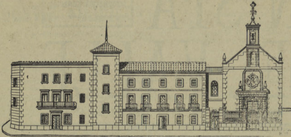
Pozoblanco. Colegio Salesiano de 1. a y 2. a Enseñanza, en régimen de internado, externado y mediopensionado