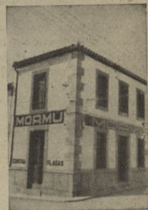
J. Benavente, 3 - Pozoblanco - Tel. 64