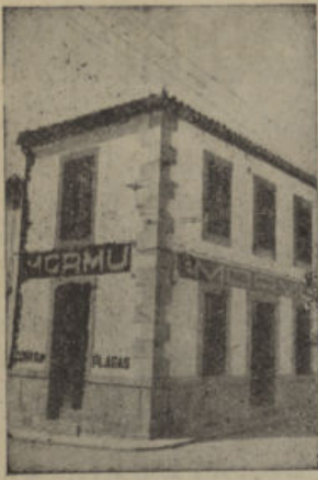
J. Benavente, 3 - Pozoblanco - Tel. 64