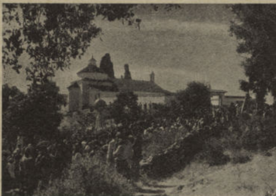
Alrededores de la Ermita en día de fiesta de la Cofradía de Villanueva de Córdoba.

pueblos y la restante en su santuario, pero que si alguno dejaba de llevarla o traerla los días que estaban señalados, perdería este derecho sobre la imagen, cosa que ocurrió a Pedroche al no acudir cierto año en el día de su fiesta.