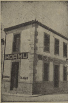
J. Benavente, 3 - Pozoblanco - Tel. 64