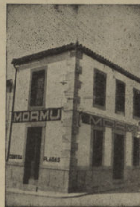
J. Benavente, 3 - Pozoblanco - Tel. 64