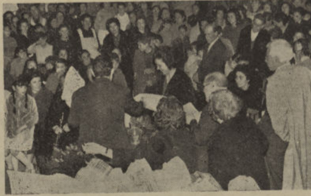
Un momento del reparto de Ayudas de Ropero Escolar

Manifestó que el Patronato presta su protección escolar en miles de millones de pesetas, distribuidas en Ayudas para Comedores Escolares y anunció que en el próximo curso funcionarán dos Comedores en sitios céntricos de la ciudad, con fondos del P.I.O., incrementados con una subvención de 60.000 pesetas procedente de Auxilio Social; en Ayudas para Roperos Escolares, como este acto tan hermoso que estamos presenciando por primera vez en nuestra ciudad; en Ayudas para transportes escolares, Campamentos y Colonias de verano, para material escolar, del cual ya se ha hecho una primera dis-