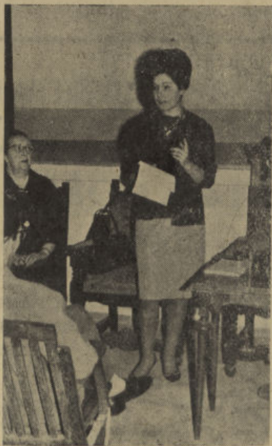
La joven y bella disertante en un momento de su intervención.