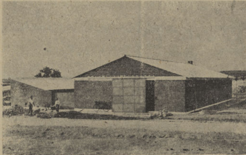
Matadero Municipal, próximo a inaugurarse