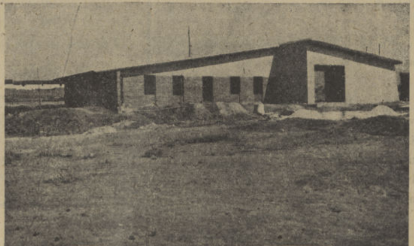
Nuevo parque y viviendas para funcionarios de Diputación Provincial, próximo a inaugurarse