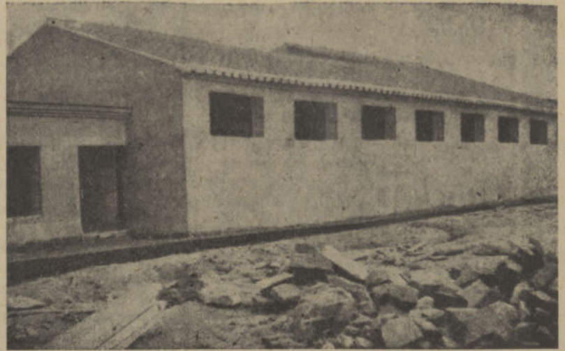
Agrupación Panadera. Obras de la primera fase a punto de inaugurarse