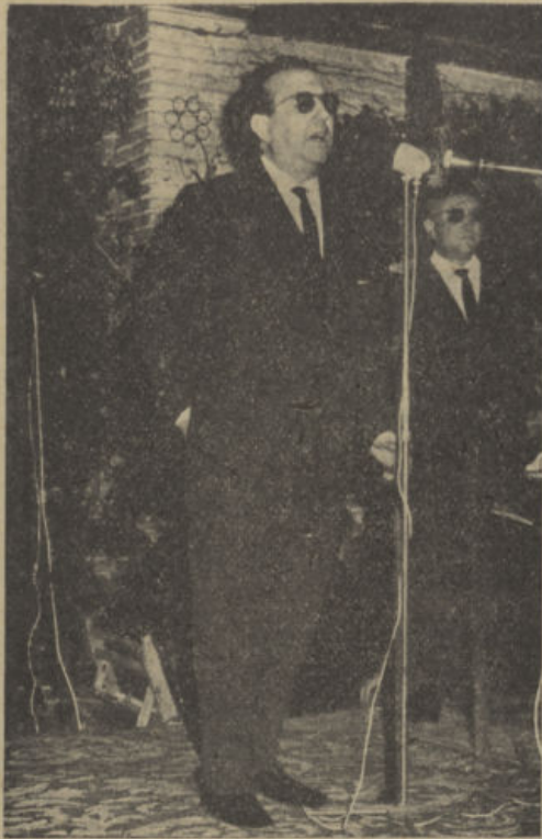
D. Luis García Tirado, Alcalde de Pozoblanco, pronunciando su brillante conferencia en la Casa de Córdoba en Madrid.