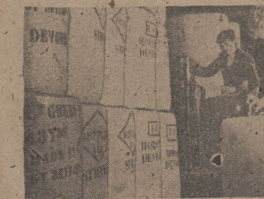
MARSELLA.—Numerosos pasajeros no han podido abandonar esta ciudad con motivo del paro. En los muelles se amontonan las mercancías con destino a varios países.