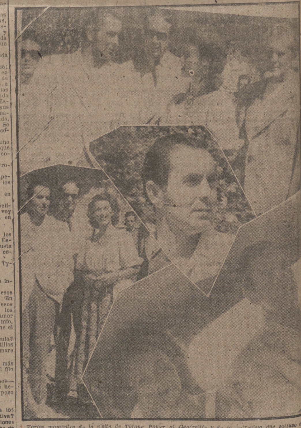
Varios momentos de la visita de Tyrone Power al Generalife y de la entrevista que sostuvo con uno de nuestros redactores.

En plena naturaleza se hermanan las Juventudes Femeninas bajo el signo de la Folaga. Alberques de verano.