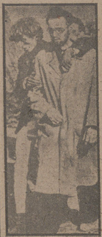
De vez en cuando, prisioneros alemanes logran escapar de la zona sujeta por los bolcheviques y alcanzan las zonas de los occidentales. He aquí el lamentable aspecto físico de dos de estos desventurados, llegados a la zona norteamericana, donde han sido atendidos como la civilización y la cultura imponen.

LONDRES, 15. (Urgente). (EFE).—En los círculos bien informados se cree que los aliados occidentales presentarán una nueva demanda dirigida directamente a Stalin, para que sea levantado inmediatamente el bloqueo de Berlín.