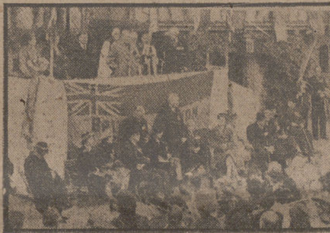
El señor Churchill, primer enemigo furibundo de los comunistas y luego amigo y aliado de ellos, hasta el punto de haberles salvado de una derrota cierta a manos de los alemanes, con la ayuda norteamericana que el ex-premier consiguió, habla ahora con frecuencia en contra de la odiosa dictadura soviética. Aquí aparece durante uno de sus discursos, recientemente pronunciado entre aplausos.