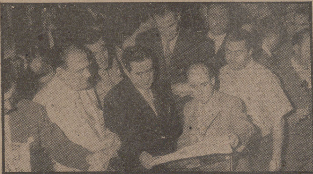
Los señores Subsecretario de Educación Popular y Director general de Prensa, con otras personalidades, asisten al acto de la salida del primer número de "La Tarde". — (Fot. SCRIP).