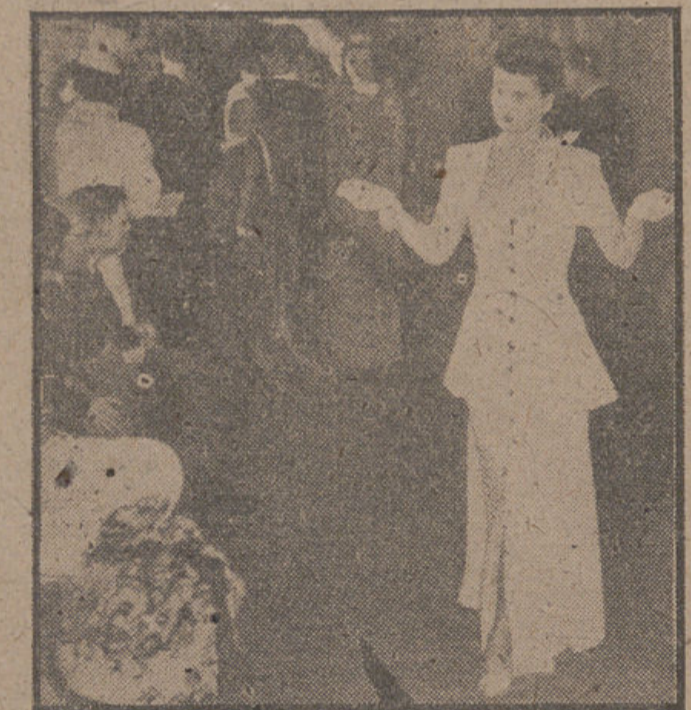
PARIS.—Desfile de modelos en una casa de modas de esta capital.