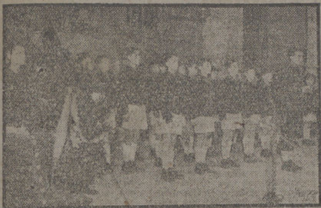
Los camaradas de la centuria "Fernando el Católico", del Frente de Juventudes de Madrid, en el acto de ofrenda de una corona de laurel sobre la tumba de los Reyes Católicos.

La centuria "Fernando el Católico", del Frente de Juventudes de Madrid, que se halla estos días en nuestra capital, con el fin de rendir homenaje a su glorioso titular, se trasladó ayer a Madrid para visitar aquella playa. Las autoridades madrileñas obsequiaron con un almuerzo a los pequeños camaradas.