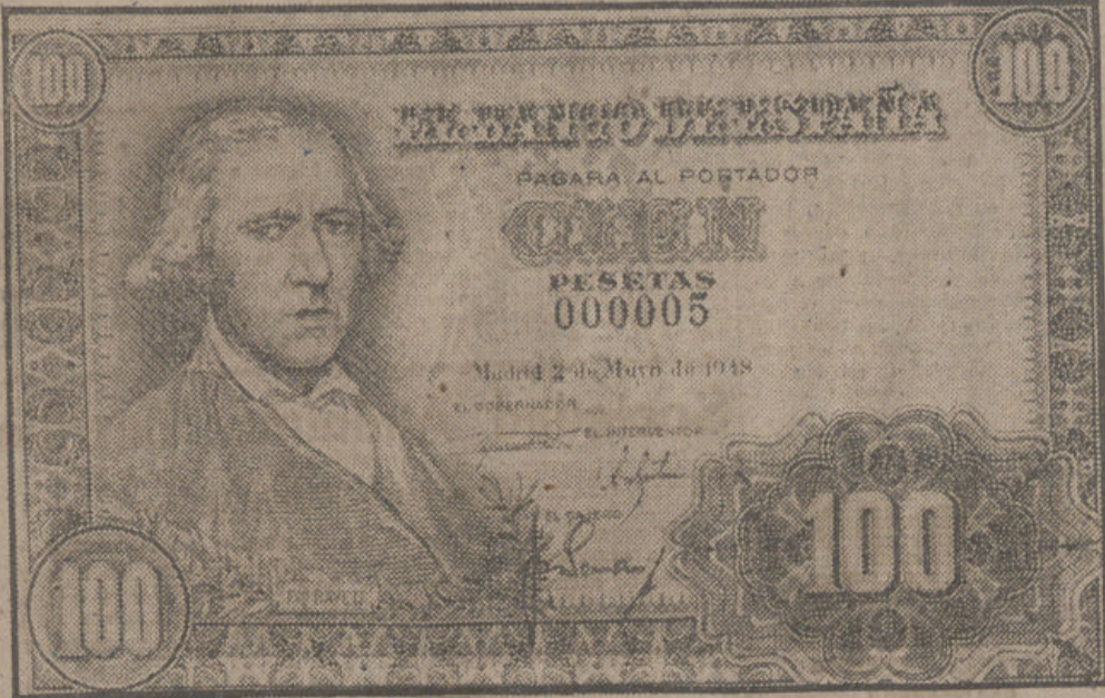
Anverso de los nuevos billetes de cien pesetas que serán puestos próximamente en circulación. Llevan un retrato del pintor Bayeu y una tirilla metálica de seguridad que por primera vez se coloca en los de cien pesetas, ya que hasta ahora solamente la llevaban los de quinientas y mil pesetas.