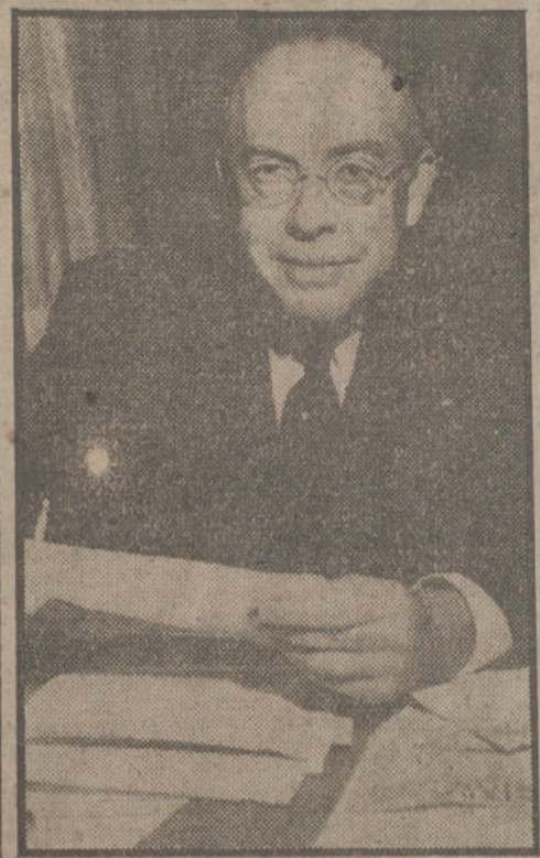
Mr. Stanton Griffis, que ha sido nombrado embajador de los Estados Unidos cerca del Gobierno español.