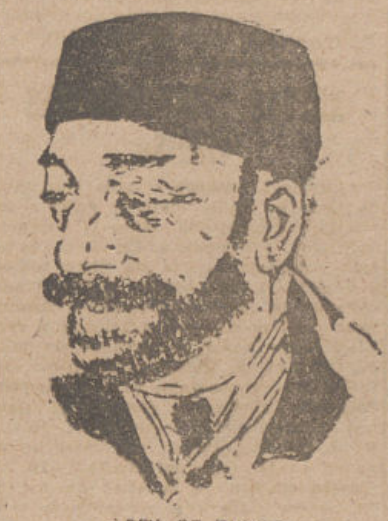
BEY DE TUNES

PARIS, 31. (EFE).—Francia hará todo lo posible por conseguir que entre en vigor, antes del próximo octubre, el programa de reformas del régimen tunecino, incluso haciendo caso omiso del propio Bey, si éste persiste en su actitud dilatoria, ha manifestado el portavoz del ministerio francés de Asuntos Exteriores.