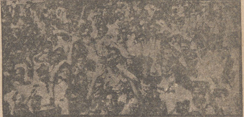
Arriba: el ex rey Faruk y su esposa, acompañados de un amigo del monarca, a su llegada al hotel de Capri, donde pasarán una corta estancia antes de marchar a los Estados Unidos.—Abajo: un grupo de manifestantes egipcios da señales de júbilo cuando se hizo público que el rey Faruk había abdicado en su hijo, el príncipe Ahmed Fuad II.—(Fots. CIFRA).

NO IR AL OTRO LADO DEL «TELÓN DE ACERO», SU ÚNICO PROYECTO