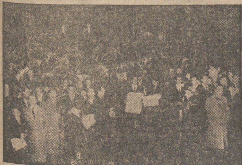
La muchedumbre, en las calles de Buenos Aires, lee ansiosamente las últimas ediciones de los periódicos con la muerte de la ilustre dama argentina, doña Eva Duarte de Perón.