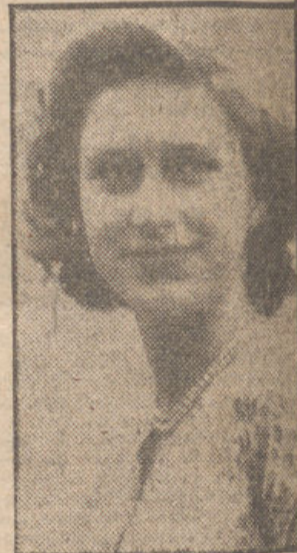
MARGARITA DE INGLATERRA

El príncipe Muley Hassan, hijo del sultán de Marruecos, tiene veintidós años y unos tesoros fantásticos: es un verdadero príncipe de las Mil y una Noches. Pues bien, hasta hoy, al joven Muley Hassan le preocupa poco todo lo que no sea el deporte y especialmente la natación. El sultán de Marruecos se siente orgulloso de su hijo, y con toda la pom-