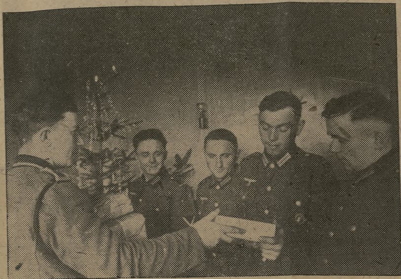
El correo trae hoy sorpresas especiales