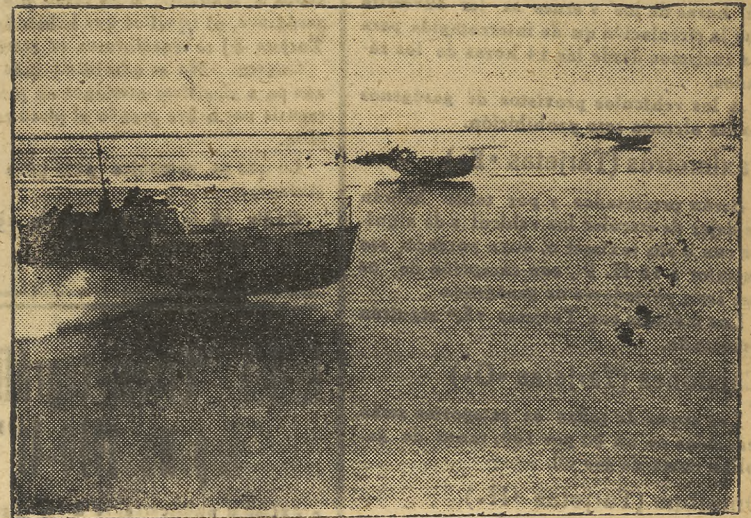
Flotilla de lanchas rápidas italianas que tan excelente papel están desempeñando en el Mediterráneo

las dos terceras partes del Congreso, parte que según el criterio constituye la opinión del pueblo de los Estados Unidos, están en contra de la guerra. Efe.