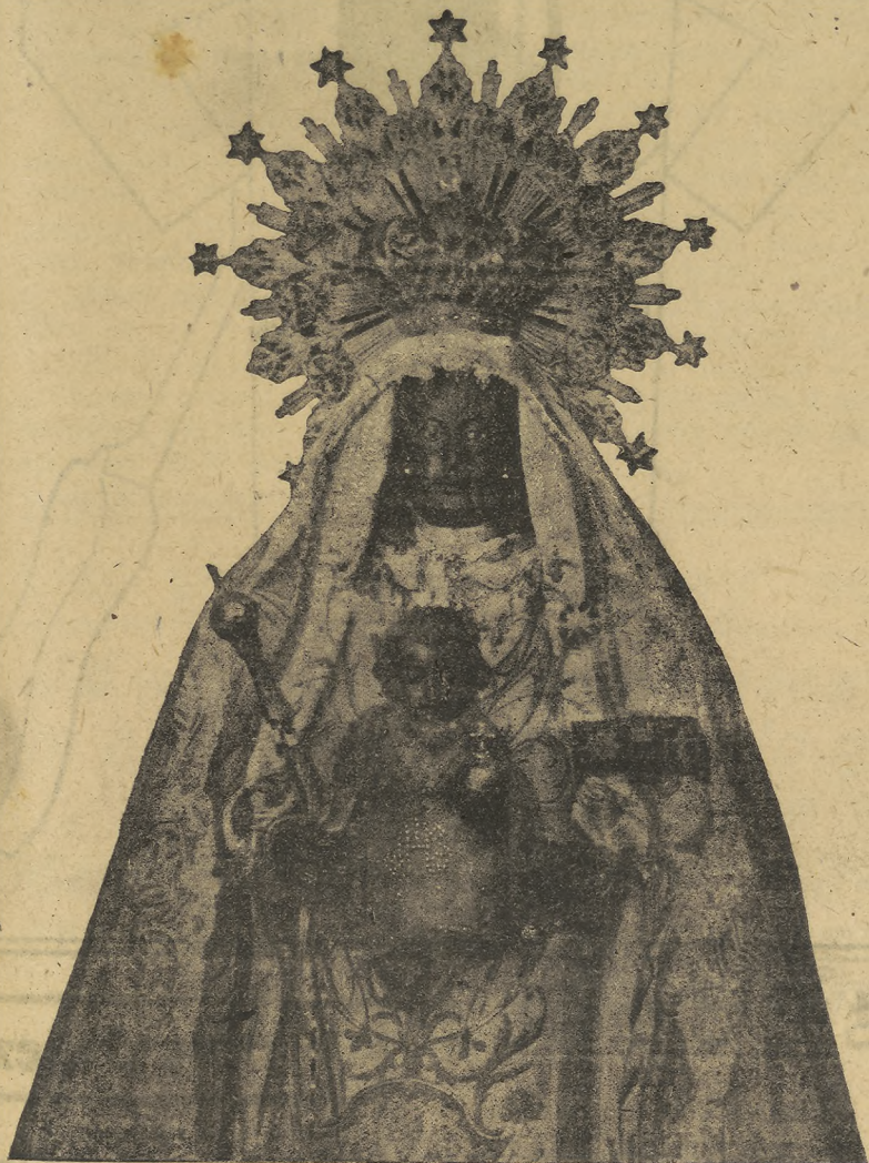
La venerada y milagrosa imagen de la Santísima Virgen de la Merced, Patrona de la ciudad, que esta tarde, a las seis, saldrá procesionalmente de su templo santuario, para recibir el público homenaje que le tributan los jerezanos

Al Sur de Odessa un crucero y un patrullero fueron incendiados. - En el sector de Kronstad otro crucero y otro destructor han sido hundidos