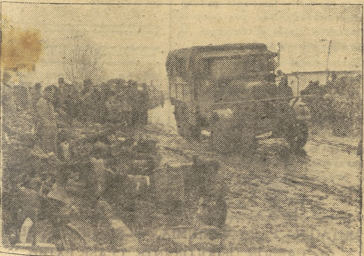
Avance de una sección motorizada alemana en Rusia

Esto ha dicho el senador Klass comentando el proyecto que calificó otro senador de un nuevo paso para la guerra. Efe.