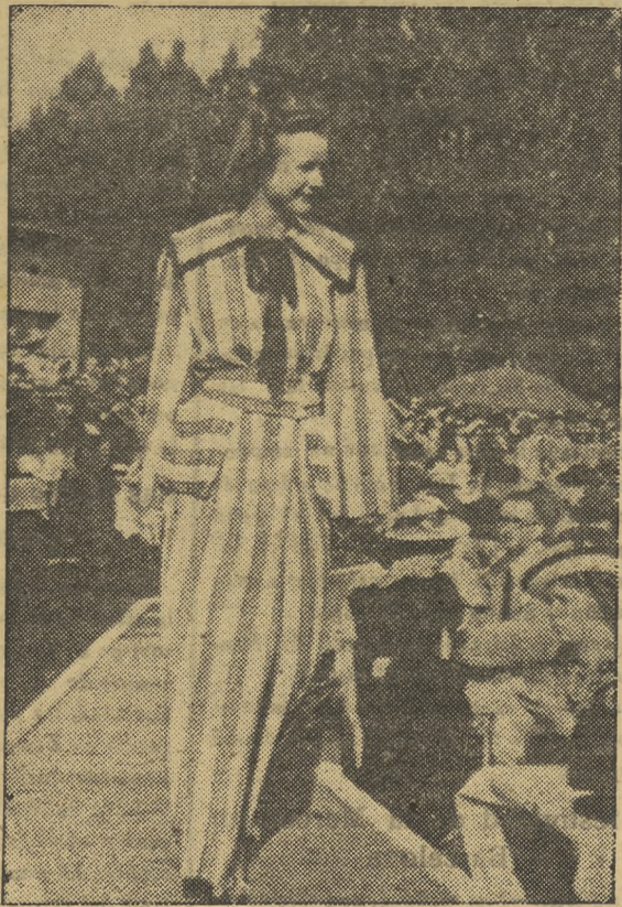
Desfile de últimos modelos en la exposición

Los visitantes que llegan de toda Alemania y del extranjero, pueden admirar no sólo las obras del arte de la floricultura, sino que tienen a la vez multitud de dis-