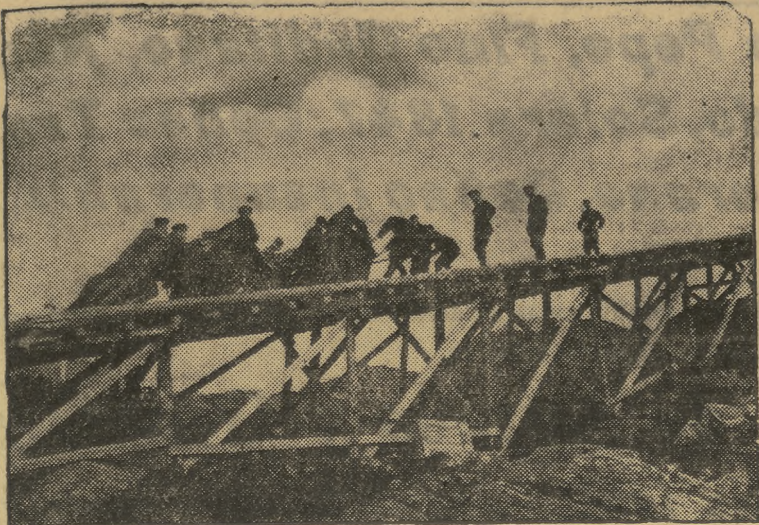
La D. C. A. alemana en Noruega