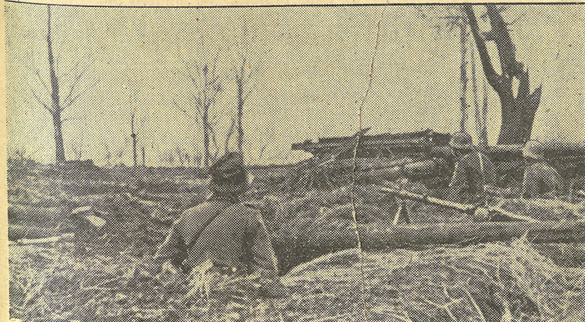
También en la región al Sur del Lago Himen va desapareciendo la nieve poco a poco. He aquí una posición avanzada de la Infantería alemana, en la cual no se ve ya la huella del invierno.