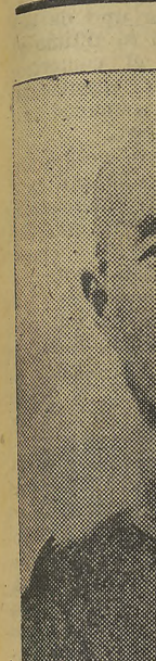
El general Ter... destacadas fig... penés, aparece decoraci...