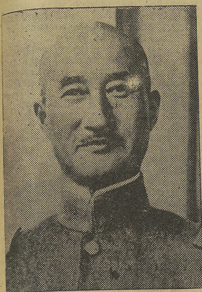
El general Terauchi, una de las más destacadas figuras del Ejército japonés, aparece aquí sin una sola condecoración.

Génesis de los galardones al valor militar