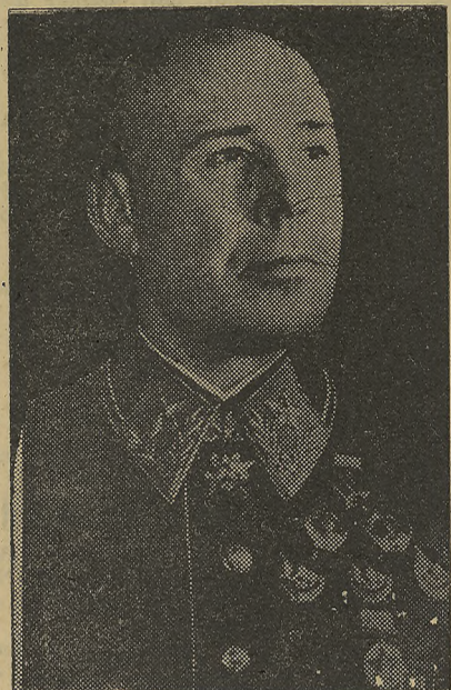
Timochenko, mariscal de la Unión Soviética, es, pese a las teorías igualitarias, entusiasta partidario de las Medallas.

en Roma por los galos en su primera invasión. Este collar llamado por los galos "Torques", pasó a ser según la tradición símbolo del valor desde que Tito Manlio venciera a un gallo, y teniendo en tierra le arrebatara su collar y se adornara orgullosamente con él.